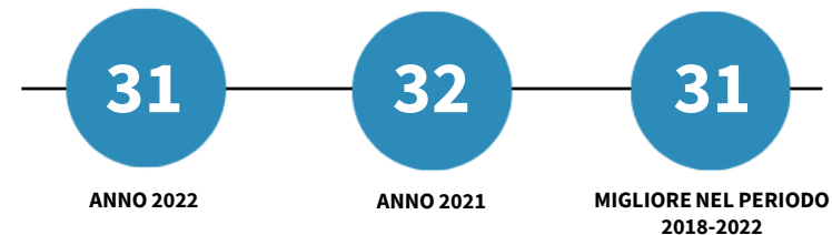
INCIDENZA PERCENTUALE VALORE AGGIUNTO SPCC SUL TOTALE VALORE AGGIUNTO - L'ANDAMENTO NEL TEMPO