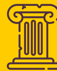
itinerari arte e cultura