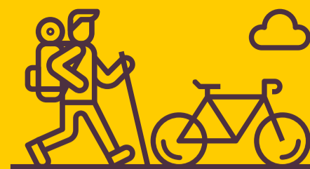
trekking e bike