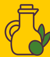
degustazioni Olio DOP e prodotti tipici