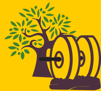
visita oliveti e frantoi